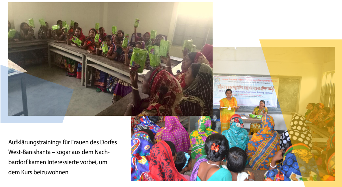
Aufklärungstrainings für Frauen des Dorfes West-Banishanta – sogar aus dem Nachbardorf kamen Interessierte vorbei, um dem Kurs beizuwohnen

Wie die Zukunft aussehen könnte: Unsere ersten Aufklärungstrainings haben solch ein herausragendes Feedback nach sich gezogen, dass wir sie auch in weiteren Dörfern der Region anbieten wollen. Wir unterstützen bei der Produktion und Installation von frauenfreundlichen Waschräumen und Latrinen in Schulen und Colleges. Sei weiterhin Teil des Ganzen – es lohnt sich!