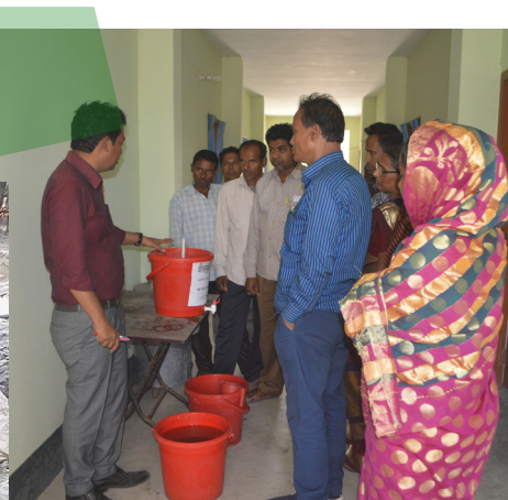
Das Water4Dacope-Projekt und wie es gewachsen ist: Coaching des Wasser-Komitees sowie Aufbau des neuen Pond-Sand-Filters