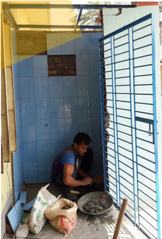
Unten: Aufbau und Fertigstellung des Wassertanksystems an der Kakra Bunia Grundschule