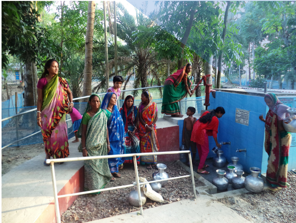
Oben: Erste Nutzung des neusanierten Pond-Sand-Filters in Saheberabad